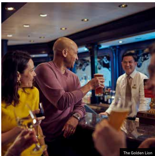
The Golden Lion

A bordo del Queen Elizabeth, los huéspedes pueden visitar algunos de los lugares más bellos y lejanos del mundo. Entre ellos se encuentran de los destinos más emblemáticos del mundo, como el puerto de Sydney, Fjordland en Nueva Zelanda y los glaciares de Alaska.