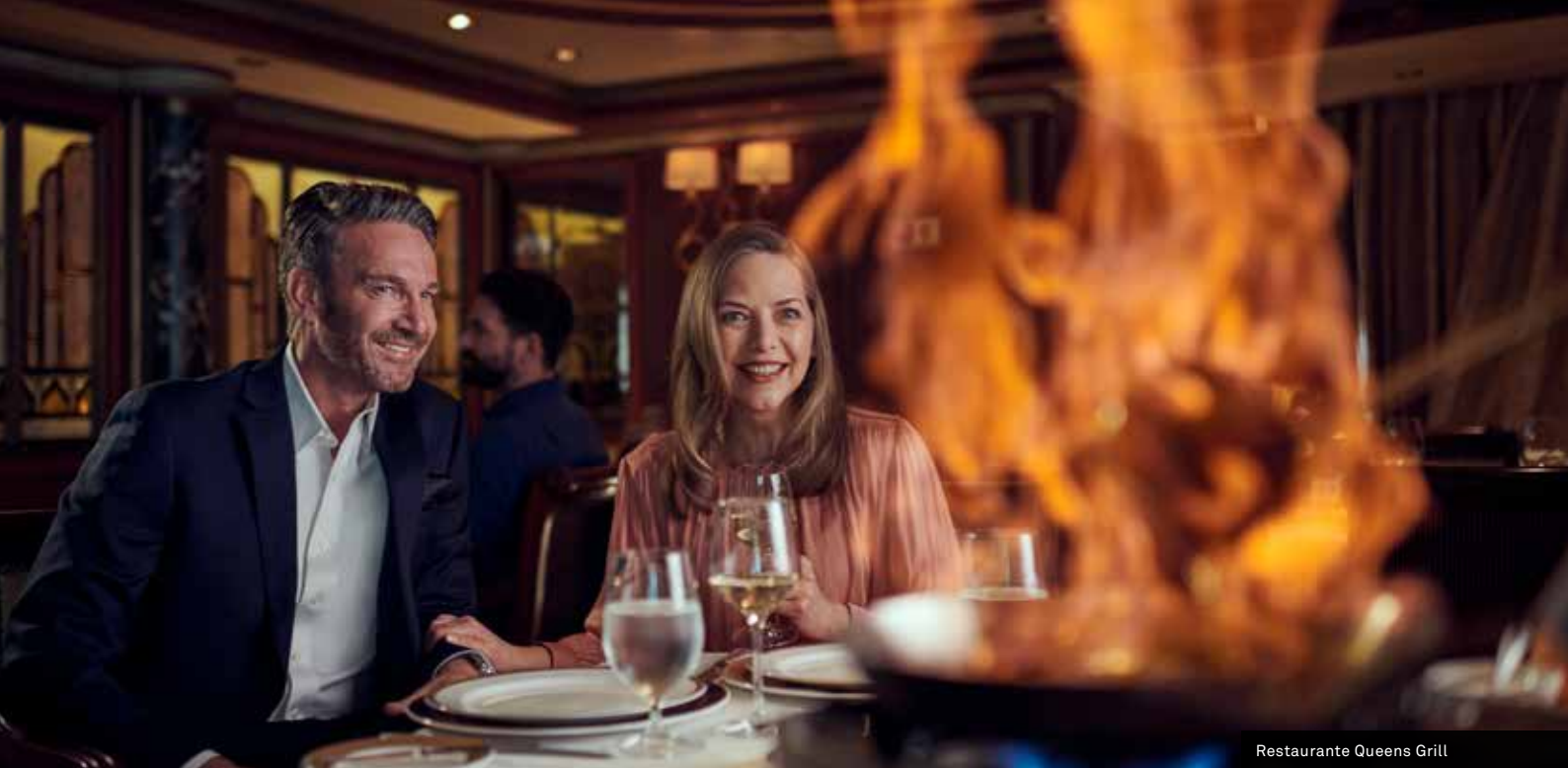
Restaurante Queens Grill