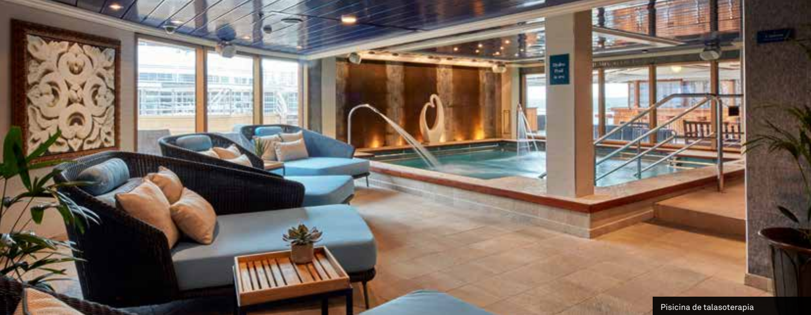
Piscina de talasoterapia