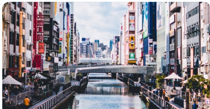
Osaka, Japón 10 de mayo 2026