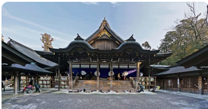
Toba, Japón 9 de mayo 2026