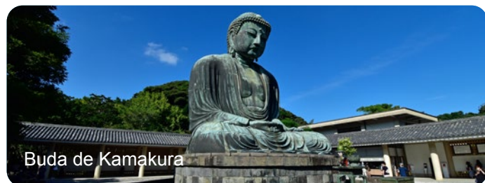
Buda de Kamakura

16 Agosto – Visita de Kamakura y embarque