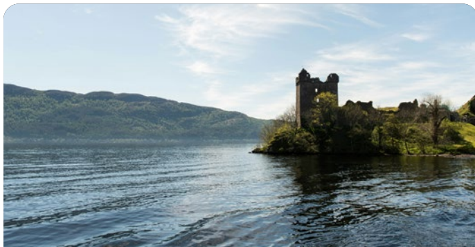
Inverness (Invergordon), Escocia 22 de agosto de 2026