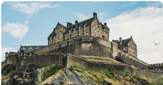
Edimburgo (South Queensferry), Escocia 18 de julio de 2026