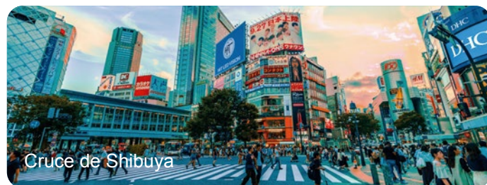
Cruce de Shibuya

Nota: Tiempo libre durante la visita para almorzar.