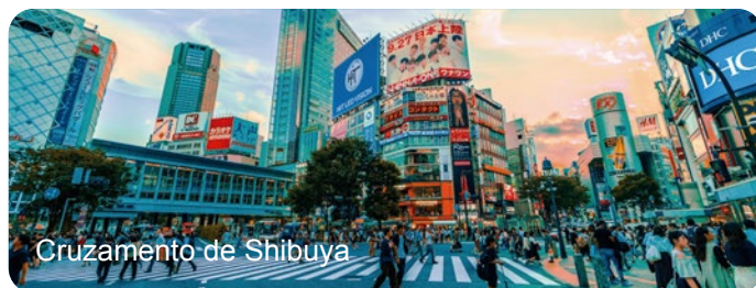
Cruzamento de Shibuya

Nota: Tempo livre durante a visita para almoçar.