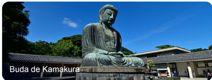
Buda de Kamakura