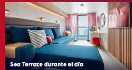
Sea Terrace durante el día