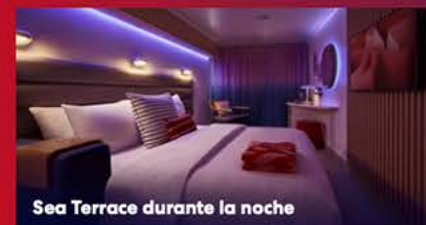
Sea Terrace durante la noche

Totalmente transformables: durante el día, tu camarote se puede convertir en una sala de estar con un sofá para relajarse, y por la noche se convierte en dos camas individuales o en una cama doble. A través de una tablet, podrás cambiar el color de las luces, la temperatura, mover las cortinas, llamar a tu asistente de cabina o controlar la TV y seleccionar tu película favorita.